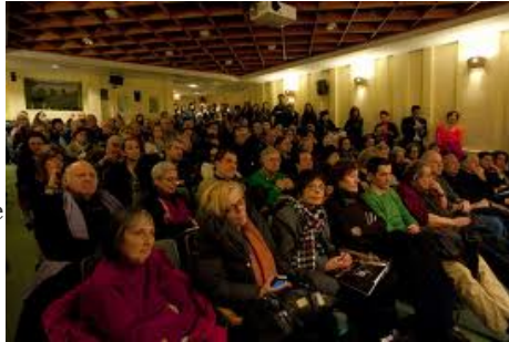
Il portone della palazzina italiana di NYU e l'auditorio affollato per un evento