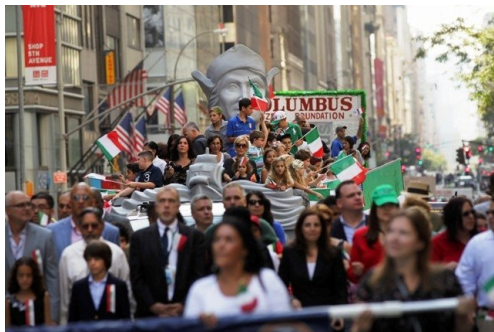
Sfilata dei carri durante il Columbus Day