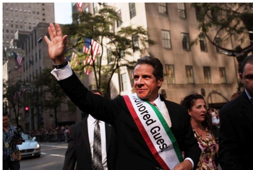
Andrew Cuomo, Governatore di New York