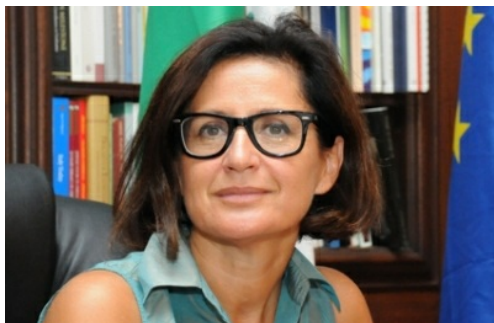
Natalia Quintavalle, Console generale d'Italia a New York