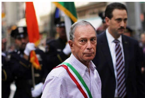
Michael Bloomberg, Sindaco di New York