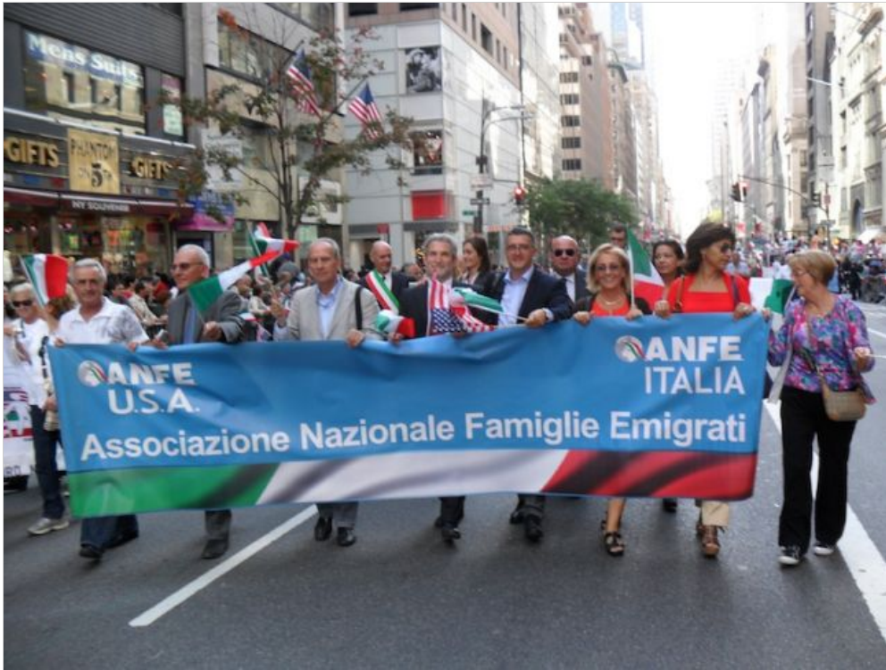
Sulla delegazione dell'ANFE

La grande sfilata sulla Quinta Avenue, in una cronacata speciale vissuta con la delegazione italiana dell'ANFE (Associazione Nazionale Famiglie Immigrate) dalla penna del rappresentante della regione Abruzzo